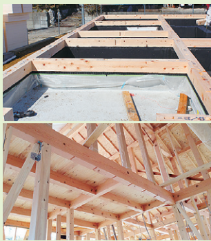
※写真はすべてイメージです。実際のものとは異なります。